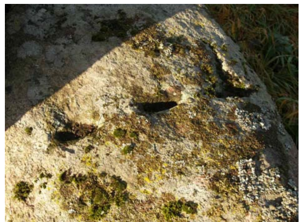
Kløvemærker på dæksten